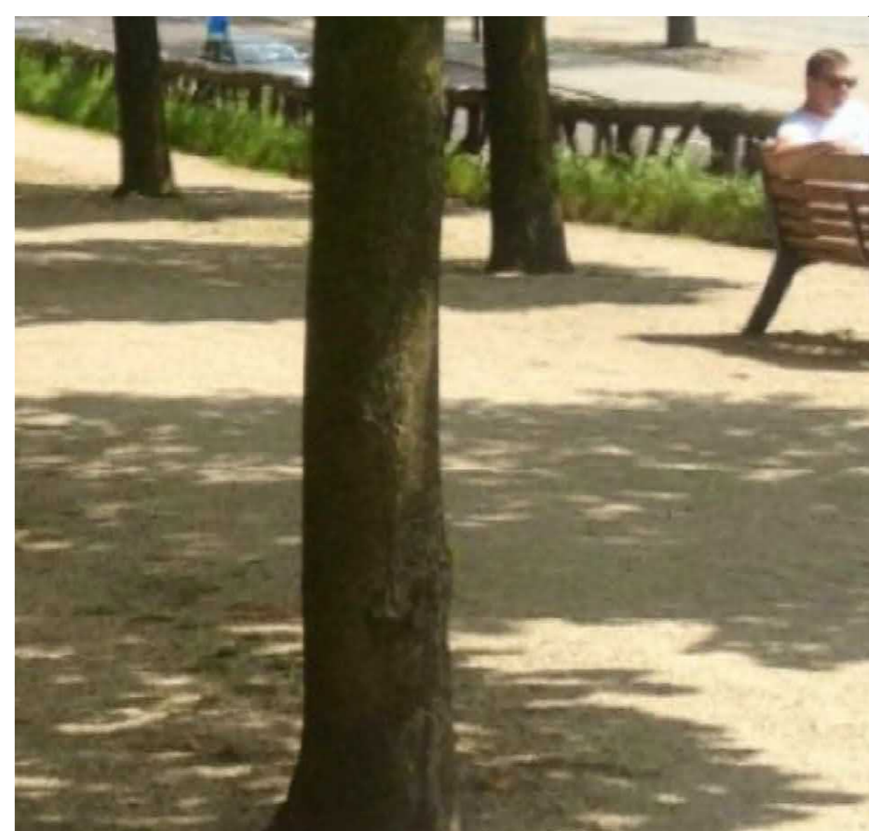
Halfverharding als boomvak in zelfde kleur als elementenverharding