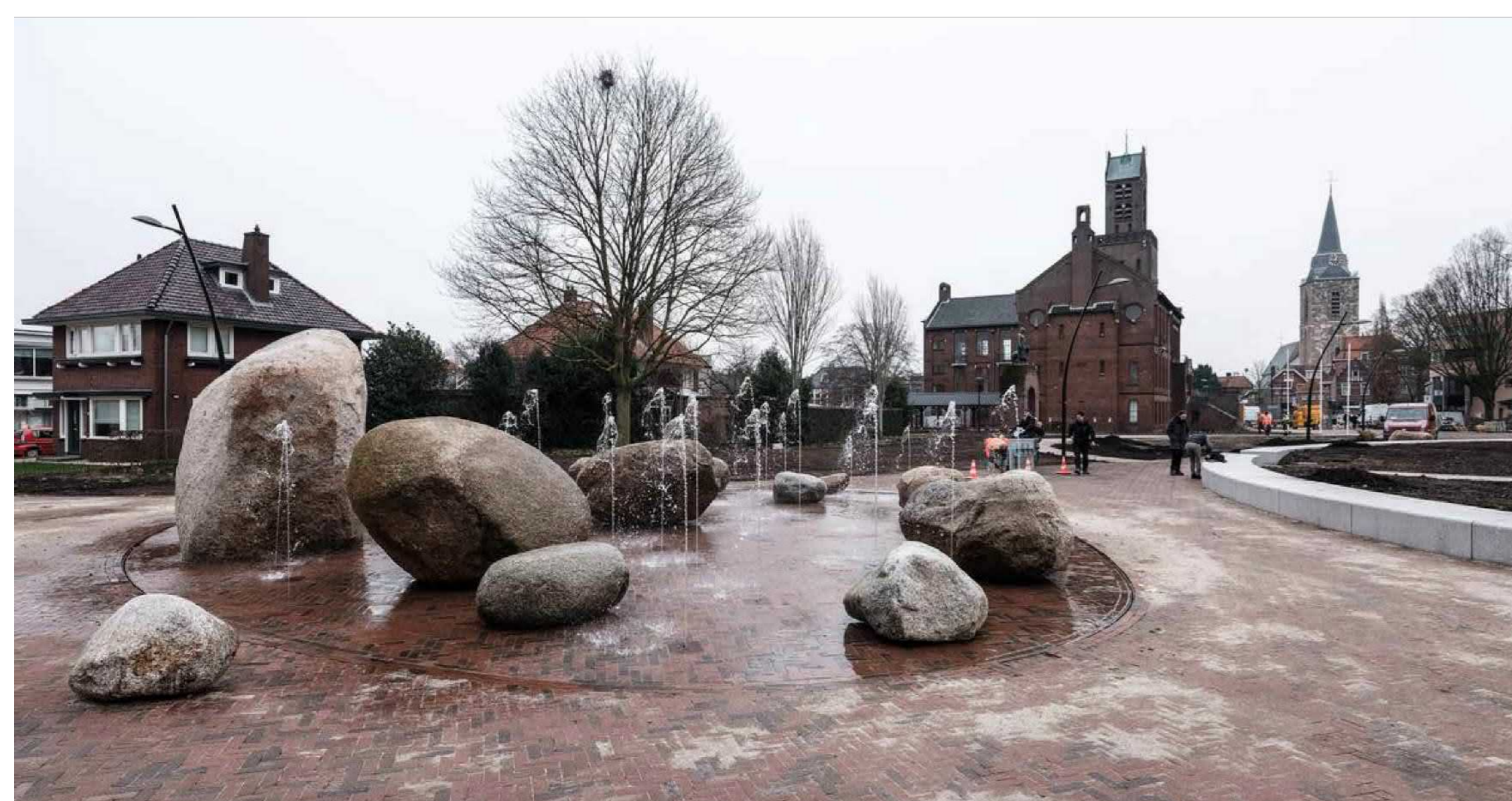
Bedriegertjes & Zwerfkeien